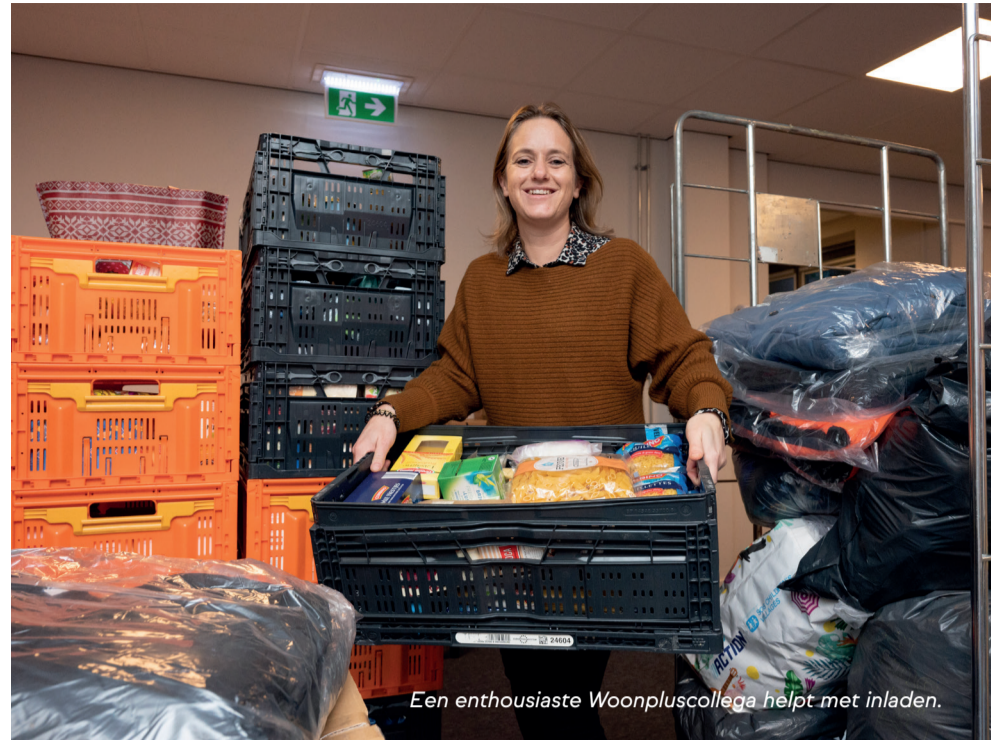
Een enthousiaste Woonpluscollega helpt met inladen.